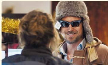
DIE BLUMEN VON GESTERN

Do 23.03. Fr 24.03. Sa 25.03. So 26.03. Mo 27.03. Di 28.03. Mi 29.03.