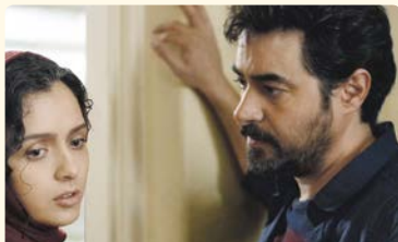
THE SALESMAN - FORUSHANDE

23:30 Ravin Iran Fr & Sa OMU Dokumentarfilm, CH 2016, 84' Regie: Susanne Regina Meures